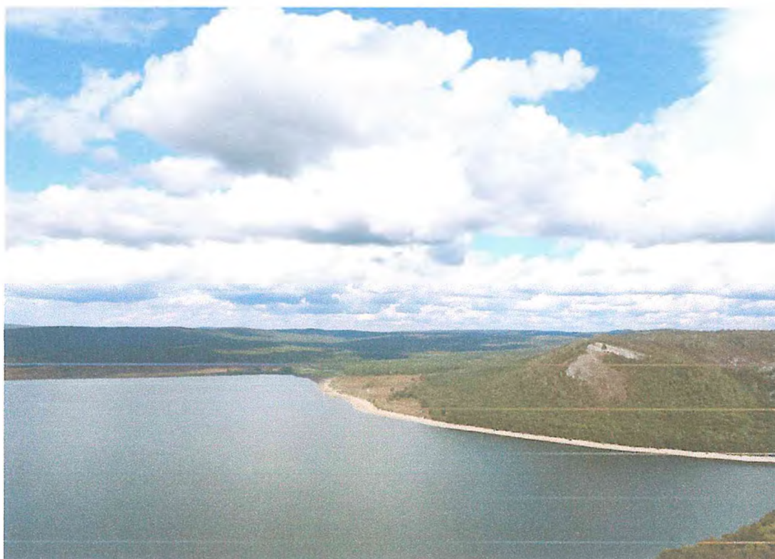
Фото 2. Вид на Нугушское водохранилище со смотровой площадки № 3.